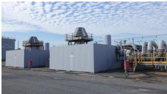
รูปที่ 3-41 Enclosure