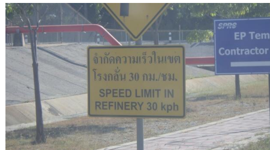
รูปที่ 3-34 ป้ายจำกัดความเร็ว

ภาพถ่ายประกอบการปฏิบัติตามมาตรการป้องกันและแก้ไขผลกระทบสิ่งแวดล้อม (ระยะดำเนินการ) โครงการโรงกลั่นน้ำมัน บริษัท สตาร์ ปิโตรเลียม รีไฟน์นิ่ง จำกัด (มหาชน)