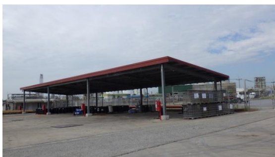
รูปที่ 3-28 พื้นที่พักกากของเสีย