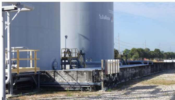
รูปที่ 3-48 คันกั้นของถัง B100