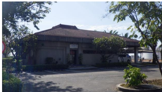
รูปที่ 3-36 สถานพยาบาล