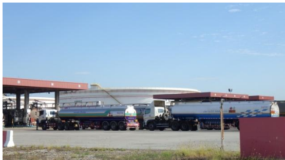
รูปที่ 3-51 สถานีสูบน้ำทางรถ