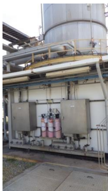
รูปที่ 3-9 CEMS ของปล่อง Tail Gas Treatment Unit