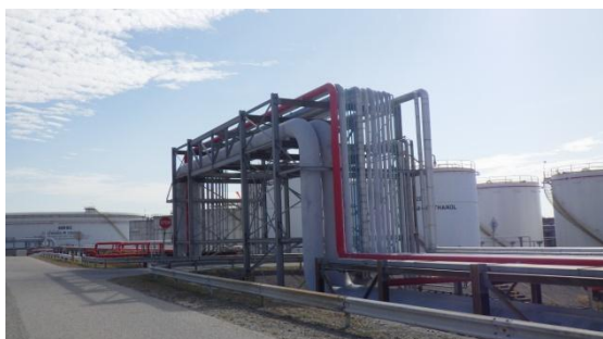
รูปที่ 3-53 Pipe Rack สำหรับท่อขนส่งน้ำมัน