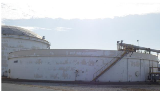
หน่วยบำบัดรวบรวมกากจุลินทรีย์ (Bio-Sludge Digester)