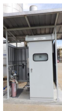
รูปที่ 3-12 CEMS ของปล่อง HRSG