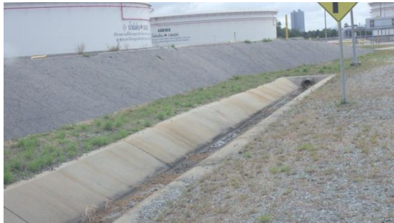
รูปที่ 3-31 รางระบายน้ำฝนแบบเปิด