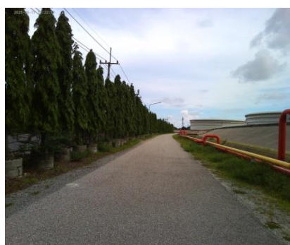
รูปที่ 3-56 พื้นที่สีเขียว

ภาพถ่ายประกอบการปฏิบัติตามมาตรการป้องกันและแก้ไขผลกระทบสิ่งแวดล้อม (ระยะดำเนินการ) โครงการโรงกลั่นน้ำมัน บริษัท สตาร์ ปิโตรเลียม รีไฟน์นิ่ง จำกัด (มหาชน)