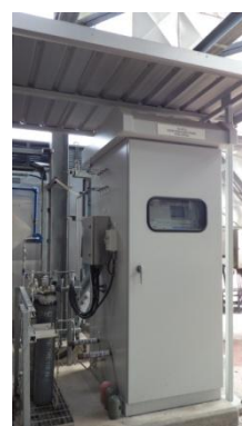
รูปที่ 3-14 CEMS ของปล่อง CDU

ภาพถ่ายประกอบการปฏิบัติตามมาตรการป้องกันและแก้ไขผลกระทบสิ่งแวดล้อม