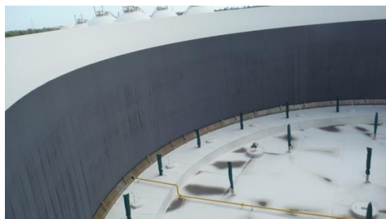
รูปที่ 3-54 ระบบกันรั่ว 2 ชั้น (Double Seal) ที่ Floating Roof Tank