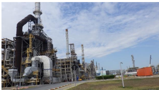
ภาพรวมของโรงกลั่นน้ำมัน