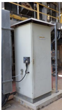
รูปที่ 3-15 CEMS ของปล่อง VDU