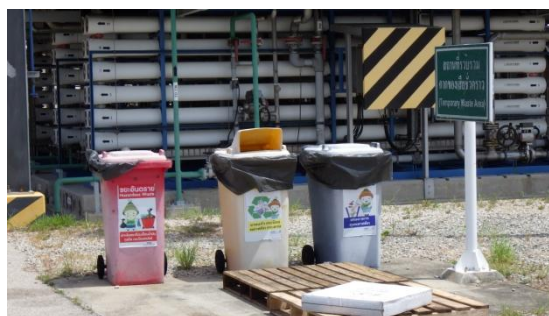
รูปที่ 3-29 ภาชนะบรรจุกากของเสียแยกประเภท