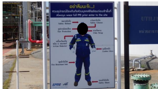
รูปที่ 3-42 ป้ายเตือนสวมใส่อุปกรณ์คุ้มครอง ความปลอดภัยส่วนบุคคล