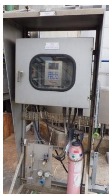
รูปที่ 3-7 Oxygen Analyzer