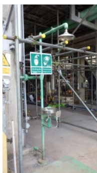
รูปที่ 3-39 ฝักบัวและอ่างล้างตาฉุกเฉิน