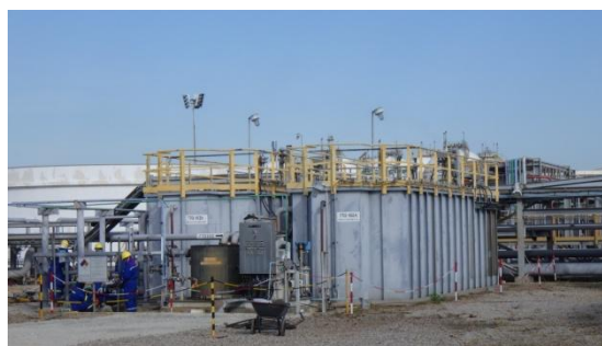
ระบบบำบัดน้ำเสียจากอาคารสำนักงาน (Sanitary System)