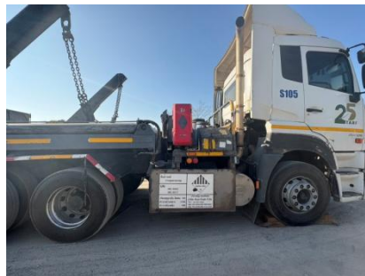
รูปที่ 3-33 การติดหมายเลขโทรศัพท์ที่รถขนส่ง