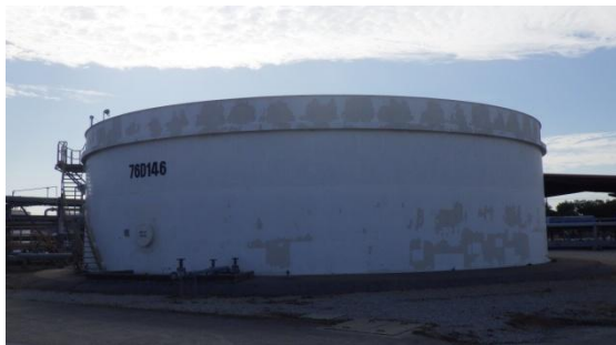
บ่อเติมอากาศ (Bioreactor Tank)