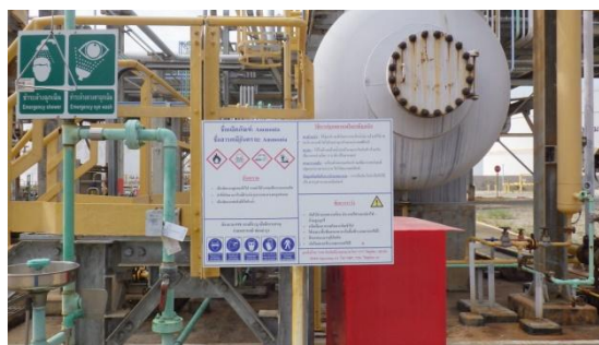
รูปที่ 3-38 ป้ายแสดงข้อมูลความปลอดภัย ของสารเคมี