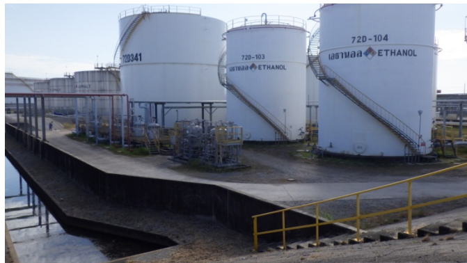
รูปที่ 3-47 คันกั้นของถังเอทานอล