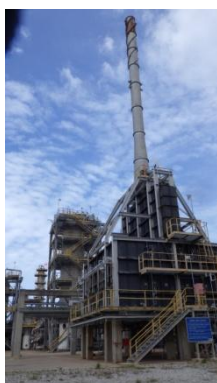
รูปที่ 3-5 HVGO Hydrotreating Unit