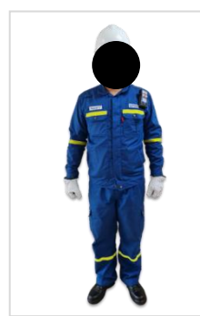
รูปที่ 3-40 พนักงานสวมใส่อุปกรณ์คุ้มครอง ความปลอดภัยส่วนบุคคล

ภาพถ่ายประกอบการปฏิบัติตามมาตรการป้องกันและแก้ไขผลกระทบสิ่งแวดล้อม (ระยะดำเนินการ) โครงการโรงกลั่นน้ำมัน บริษัท สตาร์ ปิโตรเลียม รีไฟน์นิ่ง จำกัด (มหาชน)