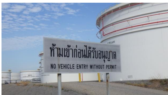
รูปที่ 3-43 ป้ายแสดงเขตพื้นที่หวงห้าม