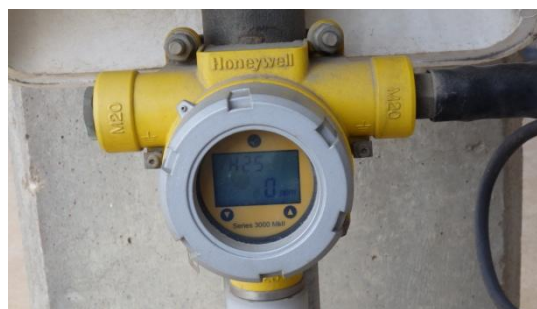
รูปที่ 3-20 H 2 S Detector

ภาพถ่ายประกอบการปฏิบัติตามมาตรการป้องกันและแก้ไขผลกระทบสิ่งแวดล้อม (ระยะดำเนินการ) โครงการโรงกลั่นน้ำมัน บริษัท สตาร์ ปิโตรเลียม รีไฟน์นิ่ง จำกัด (มหาชน)