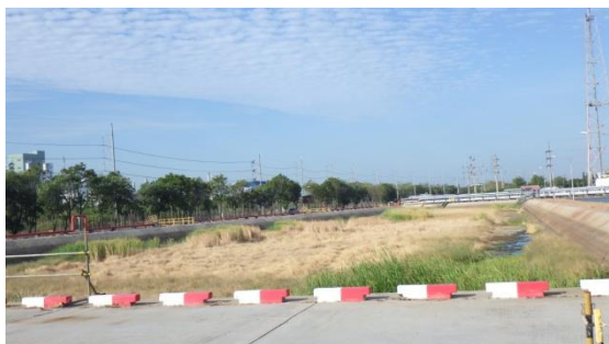
บ่อพักน้ำเสียที่ผ่านการบำบัดแล้ว (Polishing Pond)