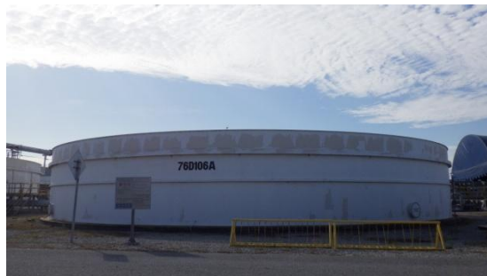
บ่อดกตะกอน (Bioreactor Clarifier)