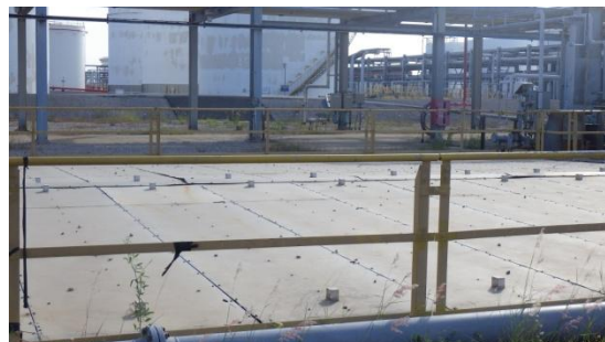
รูปที่ 3-22 ฝापิดที่ API Oil/Water Separator