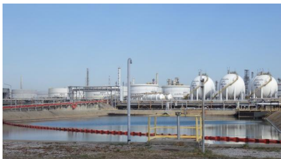
บ่อรวบรวมน้ำฝนที่มีโอกาสปนเปื้อน (Potentially Contaminated Storm Water Holding Pond)