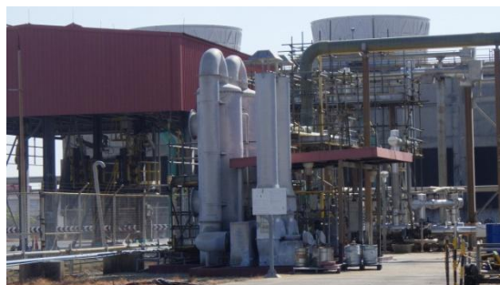
รูปที่ 3-18 Scrubber ที่ Sulfur Tank