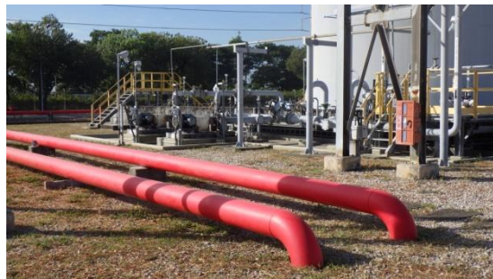
รูปที่ 3-52 อุปกรณ์ป้องกันและระงับอัคคีภัย บริเวณถัง B100