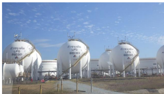
รูปที่ 3-55 ถัง LPG

ภาพถ่ายประกอบการปฏิบัติตามมาตรการป้องกันและแก้ไขผลกระทบสิ่งแวดล้อม (ระยะดำเนินการ) โครงการโรงกลั่นน้ำมัน บริษัท สตาร์ ปิโตรเลียม รีไฟน์นิ่ง จำกัด (มหาชน)