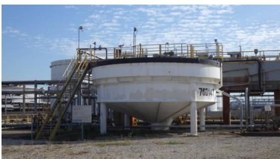
หน่วยแยกน้ำมันออกจากน้ำเสีย (Induced Air Flotation Unit)