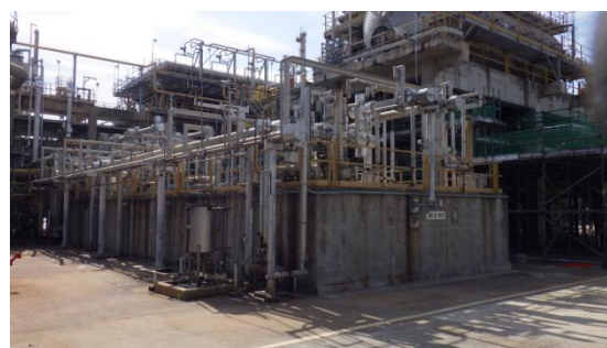
รูปที่ 3-10 ระบบดูอากาศจากบ่อซัลเฟอร์