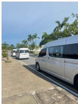
รูปที่ 3-35 รถรับ-ส่งพนักงานและคนงาน