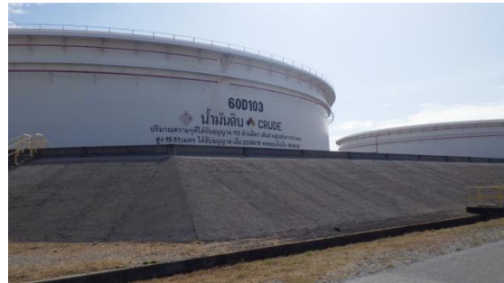
รูปที่ 3-32 คันกั้นบริเวณพื้นที่ลานถังกักเก็บ