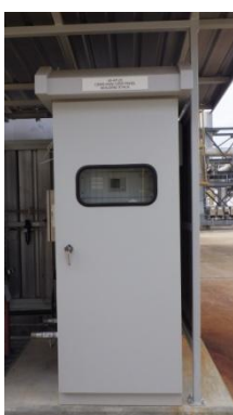
รูปที่ 3-13 CEMS ของปล่อง Boiler