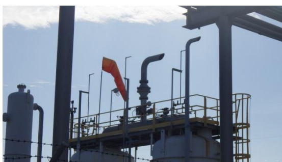
รูปที่ 3-24 Outlet ของ VRU