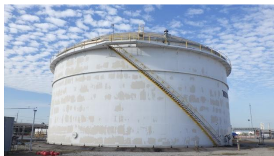
บ่อปรับสภาพน้ำเสียก่อนเข้าหน่วยเติมอากาศ (Equalization Tank)