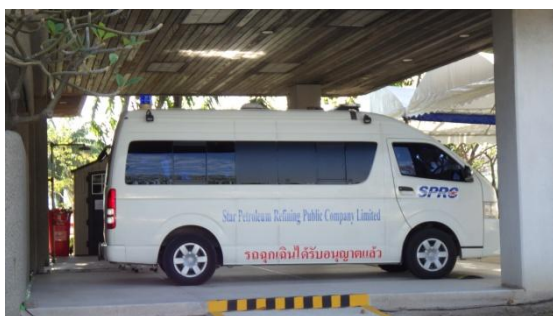
รูปที่ 3-37 รถพยาบาล