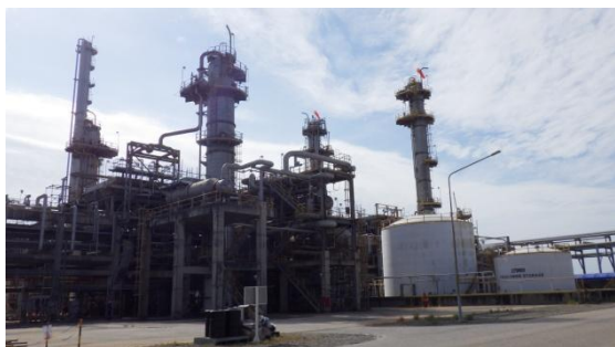
รูปที่ 3-3 Amine Regeneration Unit