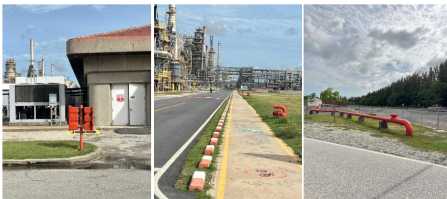
รูปที่ 3-50 ตัวอย่างอุปกรณ์ป้องกันและระงับอัคคีภัย

ภาพถ่ายประกอบการปฏิบัติตามมาตรการป้องกันและแก้ไขผลกระทบสิ่งแวดล้อม (ระยะดำเนินการ) โครงการโรงกลั่นน้ำมัน บริษัท สตาร์ ปิโตรเลียม รีไฟน์นิ่ง จำกัด (มหาชน)