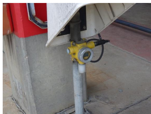
รูปที่ 3-46 Gas Detector

ภาพถ่ายประกอบการปฏิบัติตามมาตรการป้องกันและแก้ไขผลกระทบสิ่งแวดล้อม (ระยะดำเนินการ) โครงการโรงกลั่นน้ำมัน บริษัท สตาร์ ปิโตรเลียม รีไฟน์นิ่ง จำกัด (มหาชน)