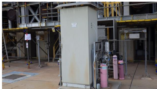
รูปที่ 3-16 CEMS ของปล่อง NHTU/CCRU