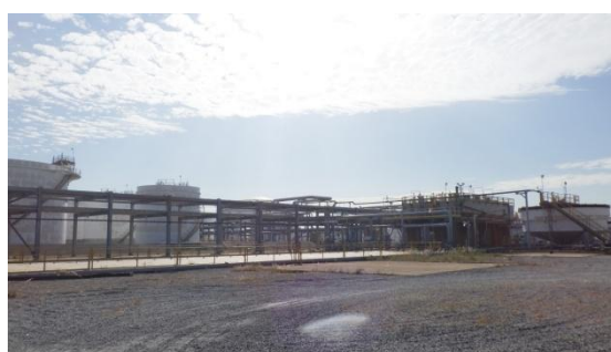
รูปที่ 3-26 ระบบบำบัดน้ำเสีย

ภาพถ่ายประกอบการปฏิบัติตามมาตรการป้องกันและแก้ไขผลกระทบสิ่งแวดล้อม (ระยะดำเนินการ) โครงการโรงกลั่นน้ำมัน บริษัท สตาร์ ปิโตรเลียม รีไฟน์นิ่ง จำกัด (มหาชน)