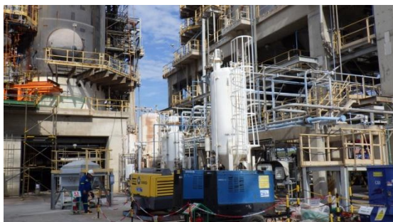
รูปที่ 3-17 DeSO x Catalyst ที่ RFCCU