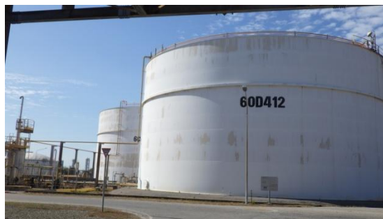
Sour Water Feed Tank