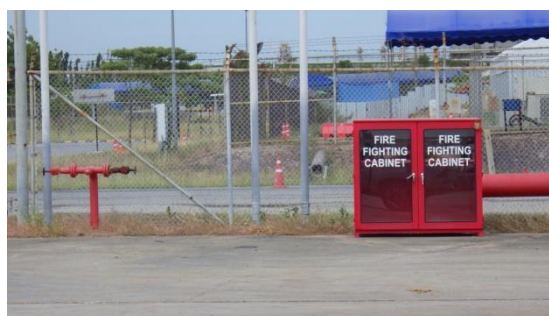
รูปที่ 3-30 อุปกรณ์ป้องกันและระงับอัคคีภัยบริเวณพื้นที่พักกากของเสีย

ภาพถ่ายประกอบการปฏิบัติตามมาตรการป้องกันและแก้ไขผลกระทบสิ่งแวดล้อม (ระยะดำเนินการ) โครงการโรงกลั่นน้ำมัน บริษัท สตาร์ ปิโตรเลียม รีไฟน์นิ่ง จำกัด (มหาชน)