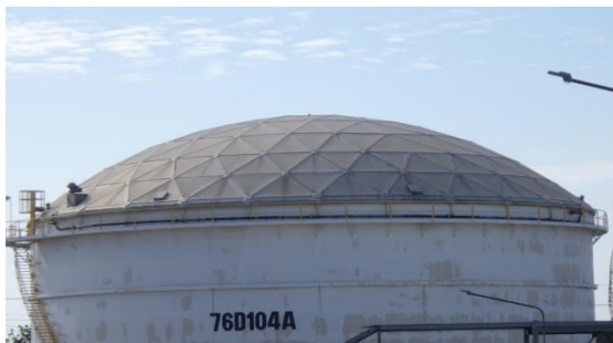
รูปที่ 3-21 ฝารอบถัง Equalization เพื่อลดกลิ่น