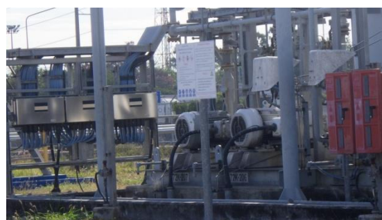
รูปที่ 3-25 Pump/Blower ของ VRU

ภาพถ่ายประกอบการปฏิบัติตามมาตรการป้องกันและแก้ไขผลกระทบสิ่งแวดล้อม