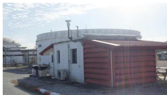
รูปที่ 3-44 ห้องปรับอากาศ