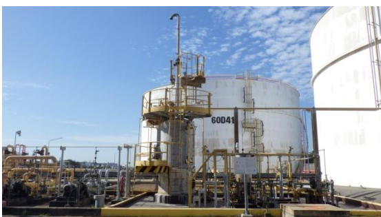
รูปที่ 3-19 Caustic Scrubber