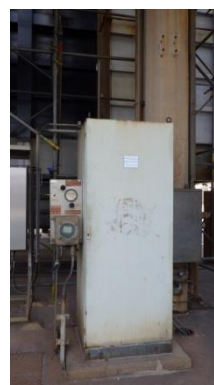
รูปที่ 3-8 CEMS ของปล่อง RFCCU

ภาพถ่ายประกอบการปฏิบัติตามมาตรการป้องกันและแก้ไขผลกระทบสิ่งแวดล้อม