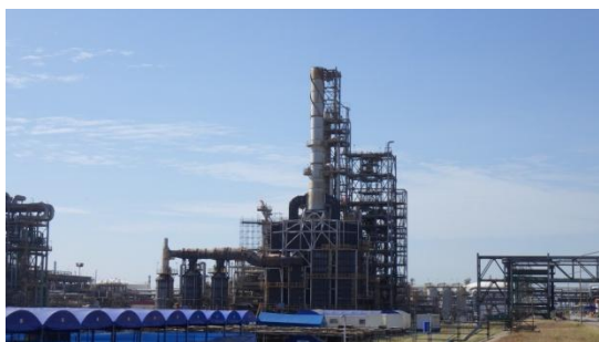
Platformer & CCR