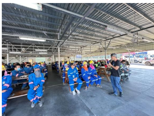
รูปที่ 3-45 การประชุมประจำวันของผู้รับเหมา