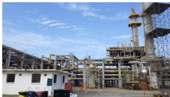
รูปที่ 3-4 Sour Water Stripping Unit