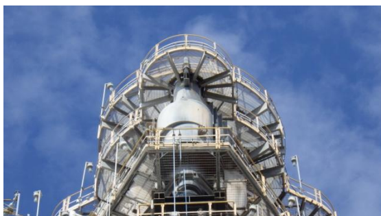
รูปที่ 3-11 Cyclone ที่ RFCCU