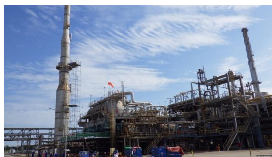
รูปที่ 3-6 Tail Gas Treatment Unit