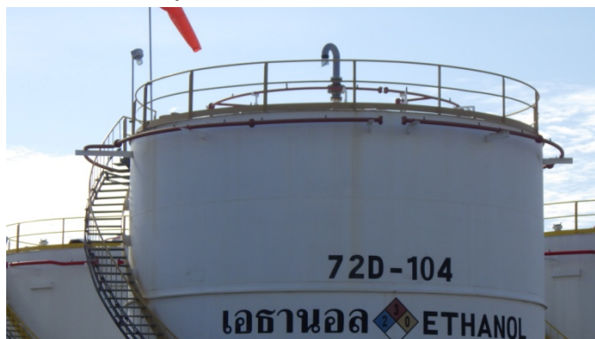
รูปที่ 3-49 Safety Valve และ Water Spray ของถังเอทานอล

ภาพถ่ายประกอบการปฏิบัติตามมาตรการป้องกันและแก้ไขผลกระทบสิ่งแวดล้อม (ระยะดำเนินการ) โครงการโรงกลั่นน้ำมัน บริษัท สตาร์ ปิโตรเลียม รีไฟน์นิ่ง จำกัด (มหาชน)